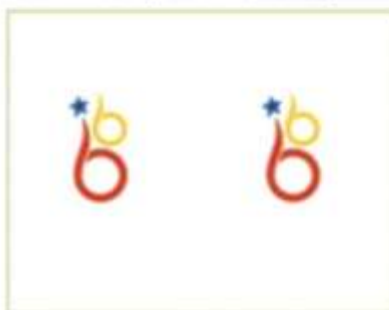
LOGO_bicentenario2.jpg 358 K Ver Descargar

5 archivos adjuntos — Descargar todos los archivos adjuntos